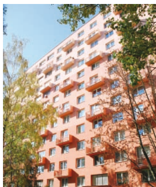
Zateplovací systém THERM P, omítky Silikon Z 1,5 mm panelový dům, Ostrava