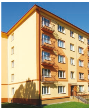
Zateplovací systém THERM P, omítky Silikon Z 1,5 mm bytový dům, Ostrava