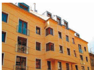
Zateplovací systém THERM P, omítka Silikát Z 2,0 mm bytový dům, České Budějovice