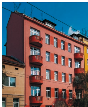
Zateplovací systém THERM P, omítky Akrylát Z 1,5 mm bytový dům, Brno