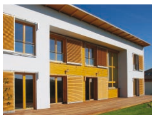
Zateplovací systém THERM P, systém SENDWIX, Silikonová zařírání omítky 1,5 mm rodinný dům, Ostrava