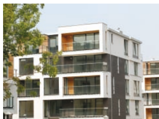
Zateplovací systém THERM M, THERM K Silikonová zařírání omítky 1,5 mm bytové domy, Praha