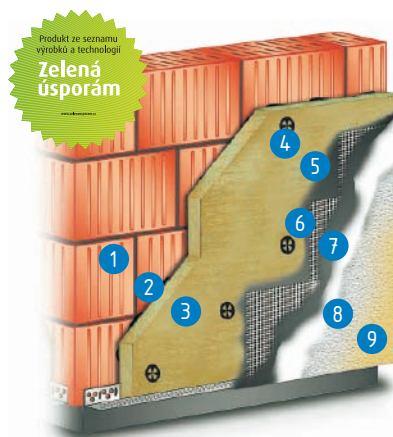
Cemix THERM M SVT 289