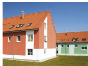
Zateplovací systém THERM P bytové domy, Rudolice