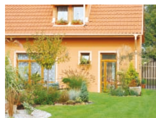
Zateplovací systém THERM M, omítky Silikon Z 1,5 mm zahradní dům, Litvínovice