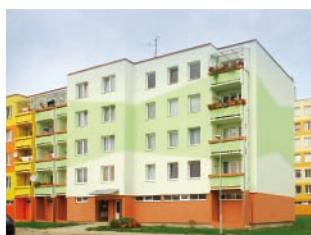
Zateplovací systém THERM P, omítka Silikon R 2 mm panelový dům, České Velenice