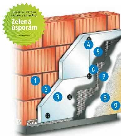
Cemix THERM P BASIC SVT 288