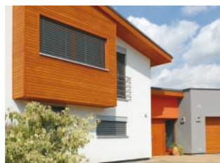
Zateplovací systém THERM P, Akrylátová zařírání omítky 1,5 mm rodinný dům, Číměř