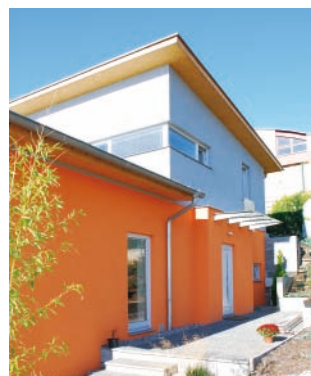
Zateplovací systém THERM P, omítky Akrylát Z 1,5 mm rodinný dům, Beroun