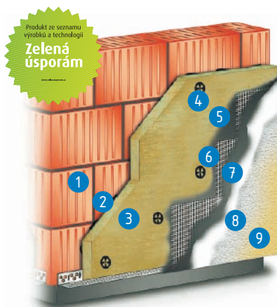
Cemix THERM M BASIC SVT 7171