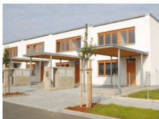
Zateplovací systém THERM P basic, Silikátová zařírání omítky 3,0 mm řadové domy, Beroun