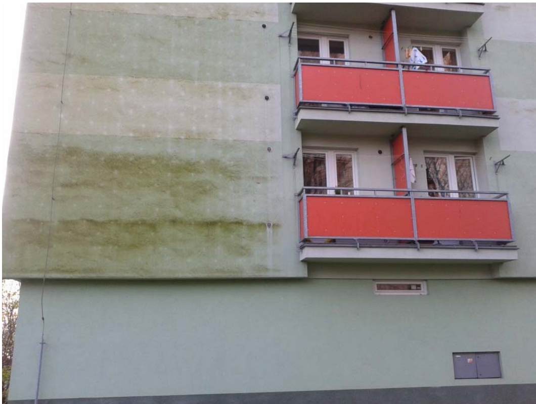
Obr. 1: Příklad výskytu biotického porostu na zateplené fasádě

Biotický porost na fasádách je jevem, kterému při nepříznivých podmínkách lze jen těžko dlouhodobě zabránit. Jedná se o estetický nedostatek, který nemá vliv na funkčnost systému. Výrobci fasádních materiálů a ETICS nenesou za vzniklé biotické napadení odpovědnost a nevztahuje se na něj tudíž záruka.