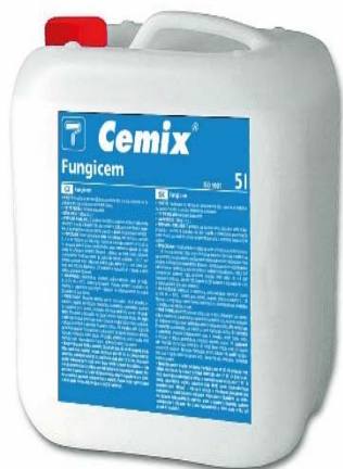
Obr. 2 – Cemix Fungicem

Pokud k biotickému napadení fasády dojde, je možné provést sanaci povrchu fasády pomocí přípravku Cemix Fungicem (obr. 2) a nového fasádního nátěru (obr. 3). Přípravek se aplikuje podle tohoto postupu a v souladu s platným technickým listem výrobku.