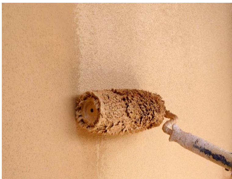
Obr. 3 - Provádění fasádního nátěru

Z podkladu se nejdříve mechanicky odstraní kartáčem lišejníky, mechy a velké vrstvy biotického napadení tak, aby nedošlo k mechanickému poškození povrchové úpravy. Dále se povrch omyje tlakovou vodou o běžné teplotě, bez přídavku mycích prostředků a zajistí se vyschnutí omítky.