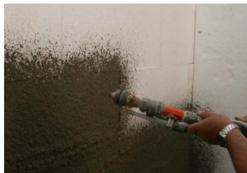
Obrázek 15: Nanášení stěrkové hmoty

Pro nanášení stěrkové hmoty použijte stroj v konfiguraci s přídatným vzduchovým kompresorem. Aplikaci stěrkovací hmoty provádějte se standardní stříkací hubicí bez přídatné hubice. Hmotu nastříkejte rovnoměrně na podklad viz. obr. 15, zapracujte do ní výztužnou síťovinu viz. obr. 16, doplňte stěrkovou hmotu nastříknutím tenké vrstvy a zarovnejte do roviny viz. obr. 17.