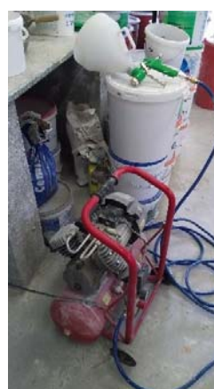
Obrázek 7: Možná konfigurace pistole s kompresorem

Na rozdíl od strojních omítaček jsou stříkací pistole i s kompresorem poměrně lehké a relativně snadno přenositelné po lešení, navíc je lze snadno vyčistit, materiál, který zůstane v zásobníku po skončení práce lze vrátit do kbelíku, takže nejsou žádné ztráty materiálu v hadicích.