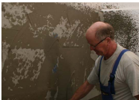
Obrázek 16: Zapracování síťoviny do stěrky

Pro nanášení stěrkové hmoty použijte stroj v konfiguraci s přídatným vzduchovým kompresorem. Aplikaci stěrkovací hmoty provádějte se standardní stříkací hubicí bez přídatné hubice. Hmotu nastříkejte rovnoměrně na podklad viz. obr. 15, zapracujte do ní výztužnou síťovinu viz. obr. 16, doplňte stěrkovou hmotu nastříknutím tenké vrstvy a zarovnejte do roviny viz. obr. 17.