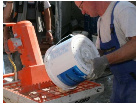
Obrázek 9: Plnění zásobníku pastovitou omítkou

Před provedením stříkání omítky je nutné provést správné nastavení stroje (zejména rychlost otáček šneku) pro rovnoměrný chod a také provést nástřik omítky na zkušební ploše.