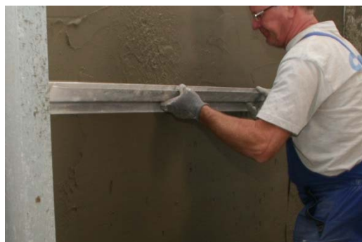
Obrázek 17: Finální zarovnání stěrkové vrstvy