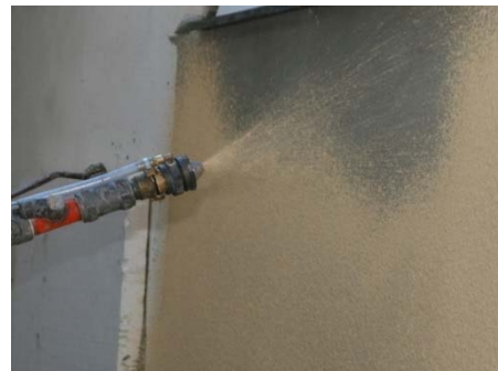
Obrázek 11: Stříkání omítky strojem PFT RITMO

Při rovnoměrném nanášení omítky není nutné u zatírané struktury provádět strukturování omítky jejím zatočením plastovým hladítkem tak, jako u ručního nanášení.