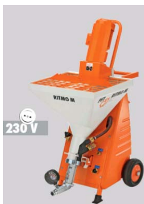
Obrázek 2: Stroj PFT RITMO M