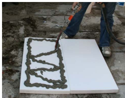
Obrázek 14: Nanášení lepidla

Pro nanášení lepidla použijte stroj v konfiguraci bez vzduchového kompresoru a upravte výkon čerpadla. Pro nanášení směsi doporučujeme použití stříkací pistole s přídatnou (delší) hubicí pro snazší aplikaci. Lepidlo se nanáší zpravidla v souvislém pásu po obvodu desky a ve tvaru „W“ v ploše desky viz. obr. 14. Důležité je v tomto případě dodržet plochu lepení předepsanou výrobcem ETICS. Desku následně nalepte na podklad.