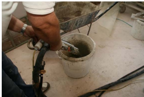
Obrázek 13: Zkouška a nastavení stroje

Pro nanášení lepidla použijte stroj v konfiguraci bez vzduchového kompresoru a upravte výkon čerpadla. Pro nanášení směsi doporučujeme použití stříkací pistole s přídatnou (delší) hubicí pro snazší aplikaci. Lepidlo se nanáší zpravidla v souvislém pásu po obvodu desky a ve tvaru „W“ v ploše desky viz. obr. 14. Důležité je v tomto případě dodržet plochu lepení předepsanou výrobcem ETICS. Desku následně nalepte na podklad.