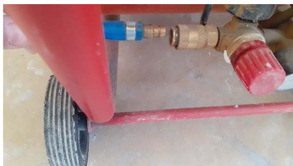
Obrázek 22: Připojení hadice ke kompresoru