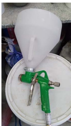
Obrázek 6: Stříkací pistole pro omítky se zásobníkem

Stříkání omítek je možné provádět také stříkací pistolí pro omítky se zásobníkem viz. obr. 6 – obdoba stříkacích pistolí pro nátěrové hmoty. Stříkací pistole pro pastovité omítky se oproti pistolím pro nátěry výrazně liší, a to zejména vnitřní konstrukcí ventilů, průměrem hadic, geometrií zásobníku a vyměnitelnými tryskami různého průměru. Omítkovina je ve stříkací pistolí poháněna stlačeným vzduchem z kompresoru. Kompresor doporučujeme pořizovat vždy zároveň s pistolí, aby byla zaručena kompatibilita. Možná konfigurace pistole a kompresoru je znázorněna na obr. 7. Tímto typem zařízení lze stříkat všechny typy pastovitých omítek Cemix kromě omítky Cemix TetraCem. Tuto omítku lze stříkat také, ale je nutné použít stroj PFT RITMO dle podmínek popsanych v bodě 2.1.