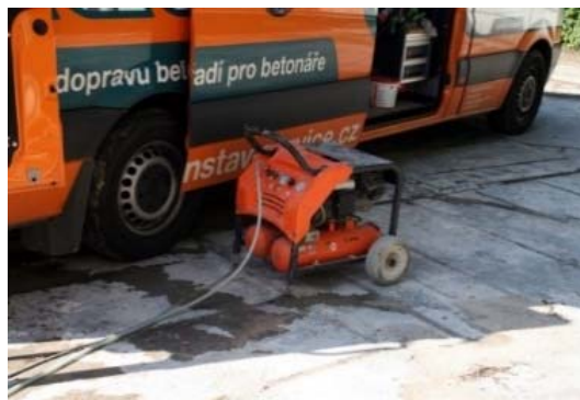
Obrázek 5: Přídavný kompresor