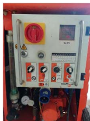
Obrázek 3: Ovládací panel stroje