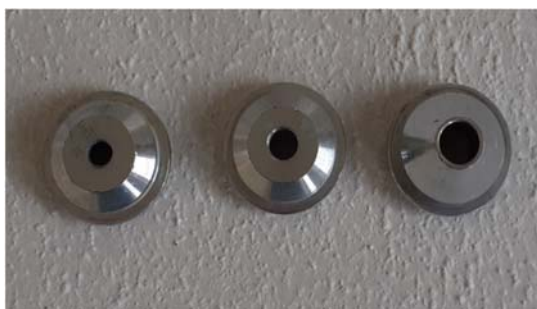
Obrázek 18: Trysky o \varnothing 4, 6 a 8 mm