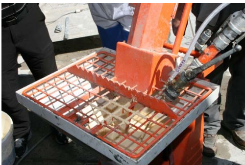
Obrázek 10: Nastavení tlaku vzduchu a výkonu čerpadla

Při nanášení omítky stříkáním na připravený podklad viz. obr. 11 dbejte na rovnoměrnou tloušťku nanášené vrstvy, tedy takovou, aby mezi zrný neprosvítal podklad, ani aby nebyla omítka nanášena v příliš silné vrstvě a nestékala.