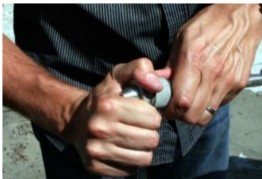
Obrázek 4: Výměna trysky