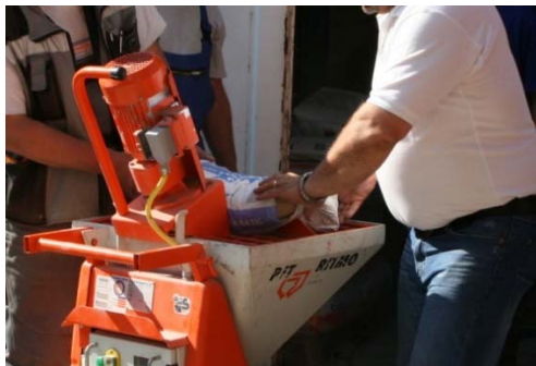
Obrázek 12: Vsyávání suché maltové směsi do zásobníku

Pro variantu stříkání lepicích a stěrkových hmot je nutná přípojka vody hadicí 3/4" a provozní tlak vody 3,5 bar. Obsah pytle vsypte do násypky stroje viz. obr. 12. Nastavte konzistenci směsi úpravou dávkování vody a konzistenci vyzkoušejte do nádoby viz. obr. 13.