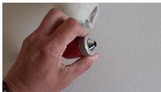
Obrázek 19: Montáž trysky

Dále je nutné seřadit vůli pístu pistole s přívodem vzduchu do trysky viz. obr. 20 a pistole připojit ke kompresoru pomocí vzduchové hadice. Hadice se připojí k pistoli a ke kompresoru pomocí rychlospojek viz. obr. 21 a 22. Před samotným stříkáním se zapne kompresor a natlakuje se na provozní tlak.