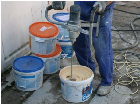
Obrázek 8: Promíchání pastovité omítky před aplikací

Pastovitou omítku nejdříve dobře promíchejte ve vědru míchadlem viz. obr. 8 a následně obsah vědra přemístěte do zásobníku/náspyčky stroje viz. obr. 9. Před použitím stroje je nutné na pistoli nainstalovat správnou trysku a seřídit výkon šnekového čerpadla a tlak vzduchu. Při nastavování stroje se doporučuje namířit trysku do náspyčky stroje, aby se materiál vrátil do zásobníku viz. obr. 10.