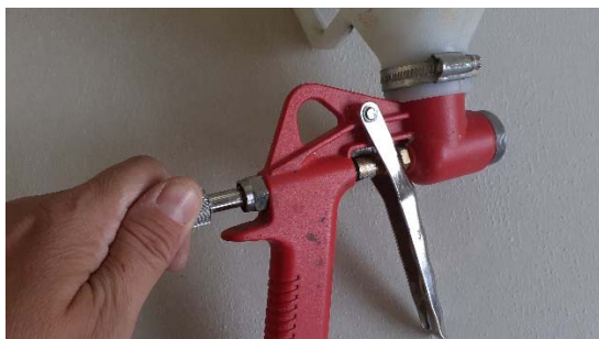
Obrázek 20: Seřízení pístu

Samotnou omítku je nutné před použitím důkladně promíchat míchadlem. Následně se omítka nadávkuje do zásobníku pistole, otevře se přírodní ventil vzduchu na pistoli a může být zahájeno samotné stříkání viz. obr. 23.